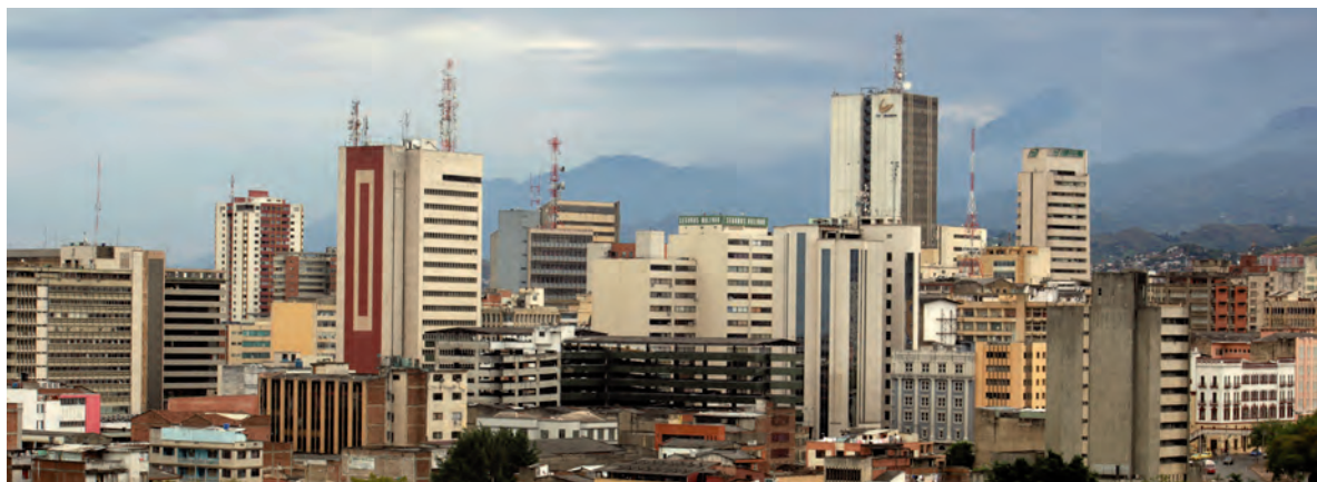
↑ Panorámica del centro de Cali (Valle del Cauca).